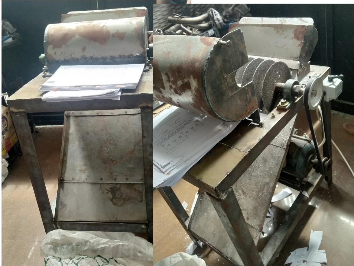
Mesin Pencacah Kertas