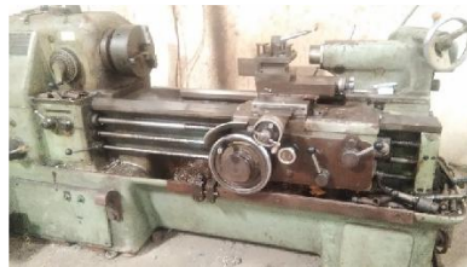
Gambar. 2 Mesin Bubut

6 Berdasarkan penelitian yang pernah dilakukan oleh mahasiswa Universitas 17 Agustus 1945 Surabaya Oleh Yaku 4 dengan Judul “Studi Eksperimen pengaruh Kecepatan Putaran Spindel (n) dan Gerak Makan (f) Terhadap Kekasaran (Ra) dan Koefisien Gesek ( \mu_s ) Permukaan Hasil Perautan Material Poros S45C.”