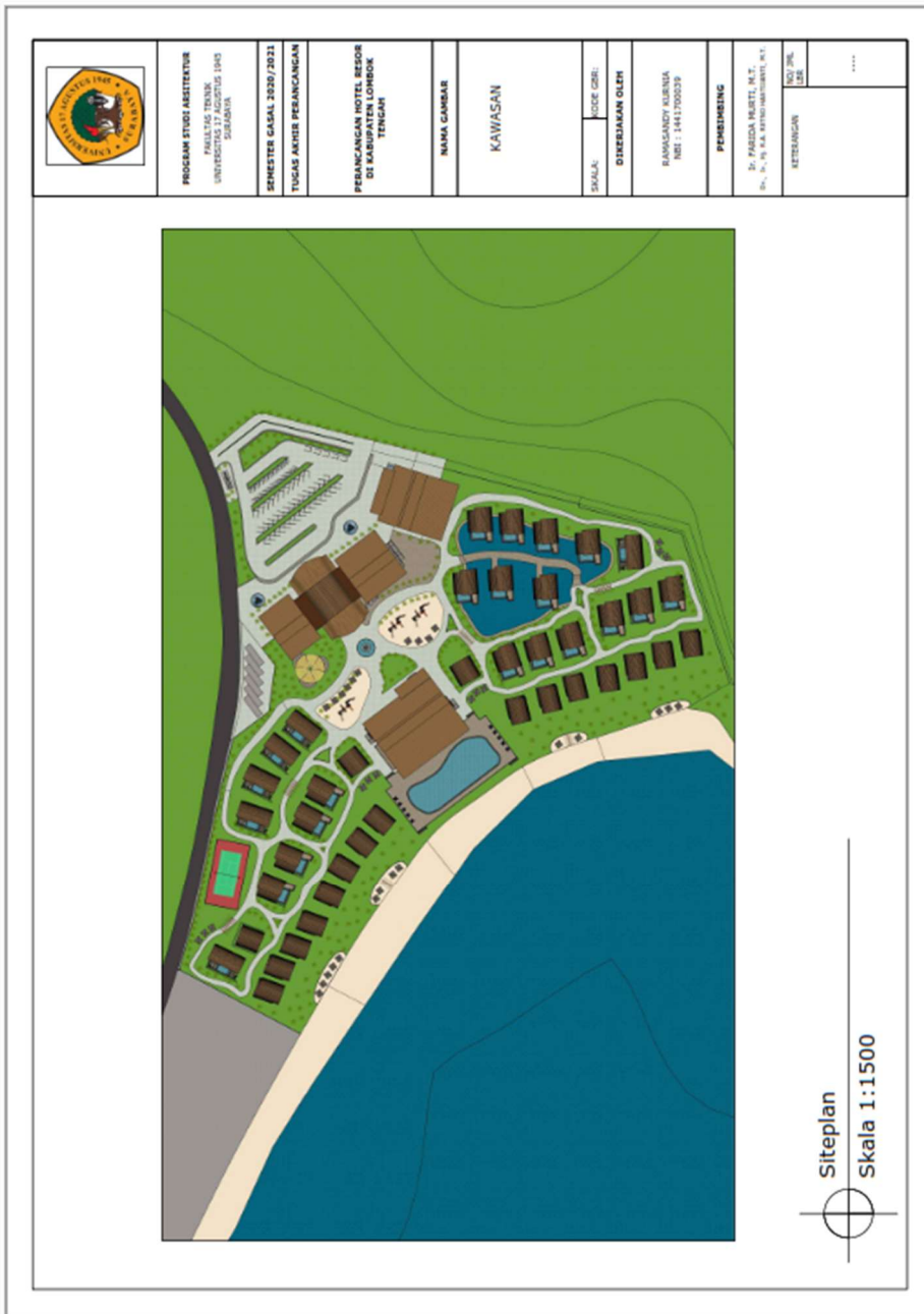
Lampiran 2. Siteplan