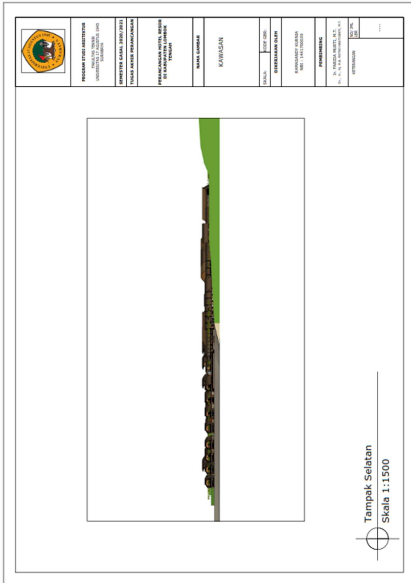
Lampiran 4. Tampak Selatan