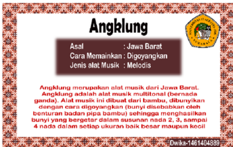
Gambar 16. Sisi belakang marker

Sisi belakang magic card terdapat nama alat musik, asal, cara memainkan, jenis alat musik yang terdiri dari ritmis (alat musik tidak bernada) untuk Gong, Gendang, dan Tifa dan melodis (alat musik bernada) untuk Angklung, Sasando, Gambus, Serunai dan Kolintang serta deskripsi singkat alat musik tradisional Indonesia. Pada pojok kanan bawah terdapat nama dan NBI pengembang sebagai watermark.