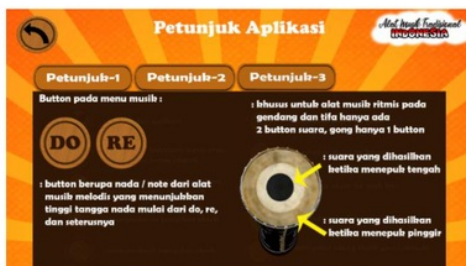
Gambar 13. Petunjuk-3

Pada Petunjuk-3 menjelaskan button musik untuk menyalakan audio tiap alat musik tradisional, yang mana tiap tombol memiliki tinggi nada yang berbeda. Terdapat dua jenis alat musik yaitu ritmis dan melodis. Musik ritmis hanya ada 1 button pada gong serta 2 button pada gendang dan tifa, sedangkan alat musik melodis lainnya berupa button Not tangga lagu yang terdapat 8 tangga nada. Ketika tombol ditekan akan keluar suara yang jika dimainkan akan menjadi rangkaian melodi untuk jenis alat musik melodis.