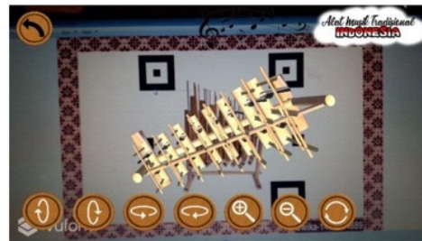
Gambar 4. Menu Buka Kamera

Menu yang berfungsi memindai marker atau image target untuk memunculkan objek 3D alat musik Indonesia. setelah diarahkan pada marker maka muncul button berupa putar atas, putar bawah, putar kiri, putar kanan, memperbesar, memperkecil dan reset atau kembali pada posisi objek semula. Dalam halaman tersebut ada beberapa tombol yaitu : 1. Putar atas yang terdapat pada paling kiri untuk memutar objek ke atas ; 2. Putar bawah, yang terdapat pada sebelah button putar atas untuk memutar objek ke bawah; 3. Putar Kanan, yang terdapat pada sebelah kanan button putar bawah untuk memutar objek ke arah kanan sisi objek; 4. Putar kiri, yang terdapat pada sebelah kanan button putar kanan untuk memutar objek ke arah kiri sisi objek; 5. Zoomin, memperbesar tampilan objek; 6. Zoomout, memperkecil tampilan objek; 7. Reset, berfungsi untuk mengatur ulang posisi objek pada bentuk semula; 8. Back, yang terdapat pada pojok kiri atas untuk kembali ke menu utama. Untuk berubah objek maka marker (image target) diganti.