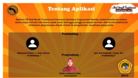
Gambar 10. Menu Tentang Aplikasi

Pada menu ini terdapat tentang aplikasi berisi deskripsi singkat aplikasi dan profil pengembang beserta profil dosen pembimbing. Form berisi deskripsi singkat aplikasi, nama pengembang, nomor induk mahasiswa, serta nama dosen pembimbing yang terdiri dari pembimbing utama dan co-pembimbing. pada pojok kanan bawah terdapat logo Universitas. Pada pojok kiri atas terdapat button untuk kembali pada menu utama.