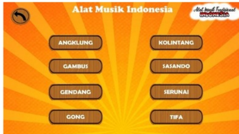
Gambar 5. Menu Alat Musik

internasional yaitu : Angklung, Gambus, Gendang, Gong, Kolintang, Sasando, Serunai, dan Tifa.