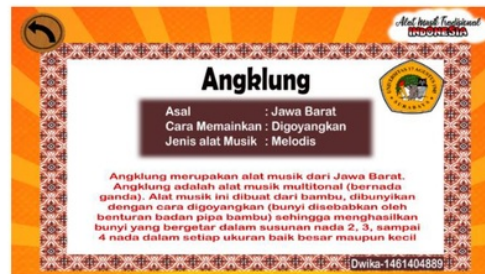
Gambar 7. Button Info

Fungsi yang terjadi saat mengklik button info nama alat musik, asal, cara memainkan, jenis alat musik yang terdiri dari ritmis (alat musik tidak bernada) untuk Gong, Gendang, dan Tifa dan melodis (alat musik bernada) untuk Angklung, Sasando, Gambus, Serunai dan Kolintang serta deskripsi singkat alat musik tradisional Indonesia.