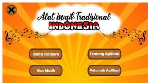
Gambar 3. Menu Utama Aplikasi

Menampilkan menu dengan daftar menu berupa Buka Kamera untuk menscan objek 3D atau mendeteksi gambar dan memunculkan obyek (ilustrasi 3D ) yang sesuai, Alat Musik berisi daftar alat musik berupa deskripsi beserta button play musik, tentang aplikasi berisi deskripsi singkat aplikasi dan profil pengembang beserta profil dosen pembimbing, serta petunjuk aplikasi berisi cara menggunakan button dan scan kamera serta cara menyalakan suara alat musik.