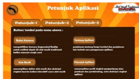
Gambar 11. Petunjuk-1

Terdapat tab-tab untuk beberapa petunjuk aplikasi mulai dari cara menggunakan aplikasi dan fungsi-fungsi dari masing-masing button tiap menu aplikasi. Pada Petunjuk-1 menampilkan button yang pada menu utama yaitu : Buka Kamera untuk menscan objek 3D atau mendeteksi gambar dan memunculkan obyek (ilustrasi 3D ) yang sesuai, Alat Musik berisi daftar alat musik beserta button play musik, tentang aplikasi berisi deskripsi singkat aplikasi dan profil pengembang beserta profil dosen pembimbing, serta petunjuk aplikasi berisi cara menggunakan button dan scan kamera serta cara menyalakan suara alat musik.