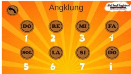
Gambar 8. Button play musik melodis

Ketika tombol ditekan akan keluar suara yang jika dimainkan akan menjadi rangkaian melodi untuk jenis alat musik melodis. Pada pojok kiri atas terdapat button untuk kembali pada menu daftar alat musik.