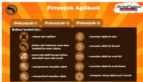
Gambar 12. Petunjuk-2

mengatur ulang posisi objek pada bentuk semula.