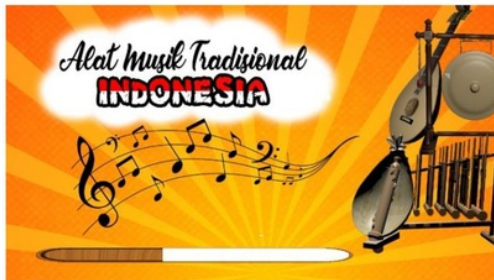
Gambar 2. Menu Intro Aplikasi

Tampilan pertama berisi halaman judul dari Aplikasi 3D Alat Musik Tradisional Berbasis Augmented Reality yang menampilkan ketika aplikasi dijalankan. berupa gambar background dengan loading bar yang berjalan sekitar 3 detik sebelum masuk ke manu utama. Kemudian sistem akan merendering ke menu utama.