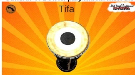
Gambar 9. Button Play musik ritmis