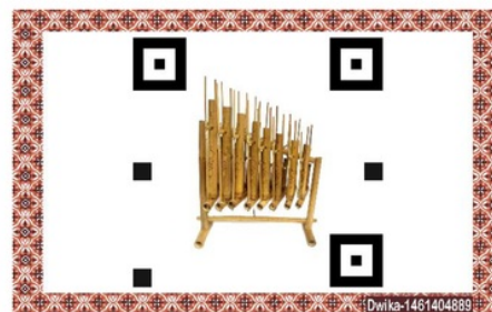
Gambar 15. Sisi depan marker

Magic card berupa kartu yang terdiri dari 2 sisi. Pada sisi depan terdapat gambar alat musik yang dapat digunakan sebagai marker. Tidak ada nama alat musik karena sisi depan magic card dapat dijadikan permainan tebak gambar alat musik tradisional Indonesia. Pada pojok kanan bawah terdapat nama dan NBI pengembang sebagai watermark.