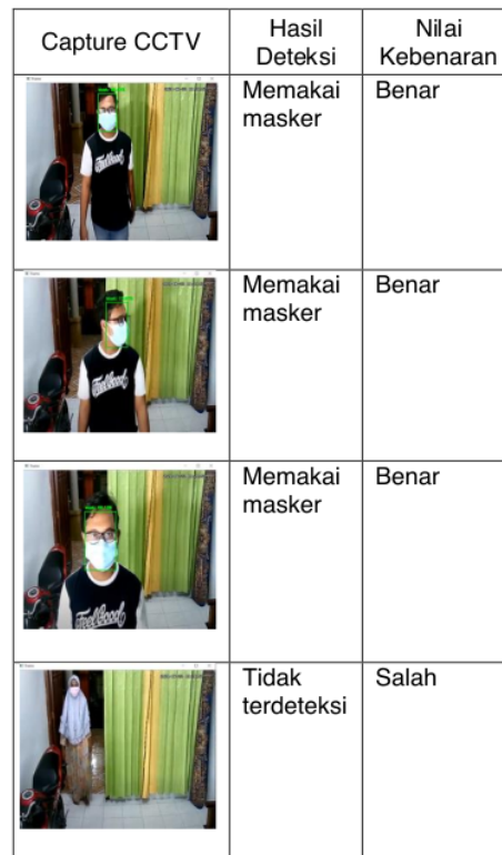
Tabel 4 Hasil pengujian dengan CCTV