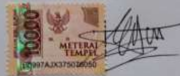
Muhammad Yunus 1461600084