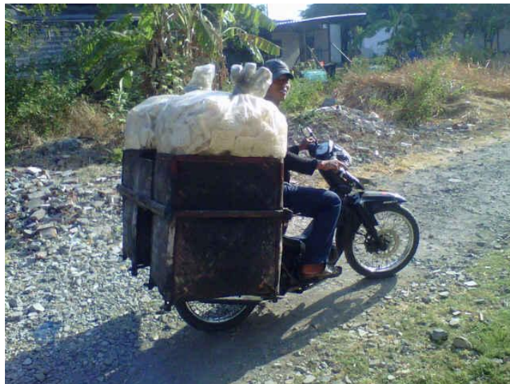
Gambar 4.1 Sejarah Awal Perusahaan Berdiri

Berawal dari pedagang kerupuk keliling diseluruh Surabaya selama kurang lebih 5 tahun dan mendapatkan modal juga pengalaman dari pedagang kerupuk tersebut. Akhir pengalaman dari pedagang krupuk pemilik usaha memutuskan untuk membuka perusahaan sendiri yang dinamakan UD. SUCI. Diawali dengan 4 karyawan dan diberikan modal berupa kaleng kerupuk untuk disebarakan luaskan ke warung-warung, kios dan toko perancang di daerah Surabaya. Ditahun – tahun berikutnya UD. SUCI hingga saat ini mampu mendirikan usaha dan mampu mendistribusikan kerupuk hingga ke Surabaya, Gresik, Madura.