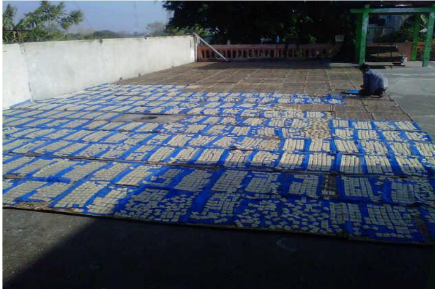
Gambar 4.2 Gambar Krupuk UD. SUCI