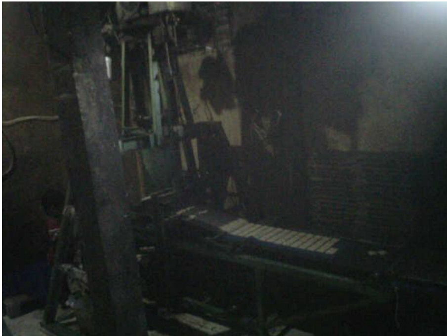
Gambar 4.4 Gambar Produksi