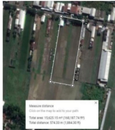
Gambar 2 : Lokasi Site

Dari kriteria site yang telah ditentukan, maka site yang terpilih untuk padepokan seni budaya Kabupaten Tulungagung berada di Jalan Khr. Abdul Fattah Botoran, Botoran, Kec. Tulungagung, Kabupaten Tulungagung, Jawa Timur 66213 yang berada di tanah lapang dengan luas lahan 15.625.15m 2 . Site ini sangat strategis dikarenakan berada di kecamatan terbesar dan mempunyai penduduk terbanyak. Kecamatan Tulungagung sendiri menjadi kota administrasi / pusat pemerintahan, perdagangan dan kebudayaan sehingga pemilihan site ini sangat tepat. Berada di tengah kota dan mempunyai akses jalan yang luas dan mudah membuat Perencanaan Perancangan Padepokan Seni Budaya ini diharapkan mampu mewadahi semua aktifitas berkesenian terutama dalam masalah Pendidikan non formal yang mengedepankan pengembangan dan pelestarian kesenian tradisional di Kabupaten Tulungagung.