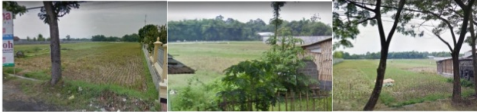
Gambar 3 : Lokasi Site