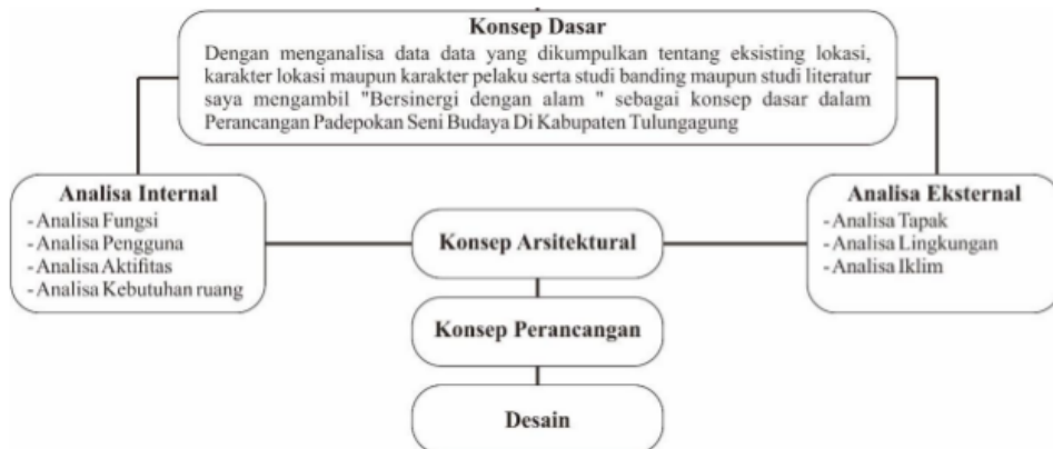
Gambar 1 : Alur Pemikiran Perancangan