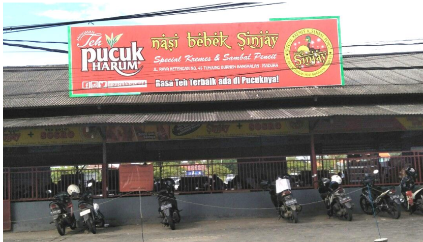
Gambar 4.2 Rumah Makan Bebek Sinjay