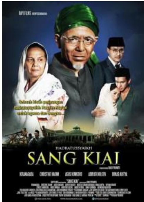
Poster Film Sang Kiai