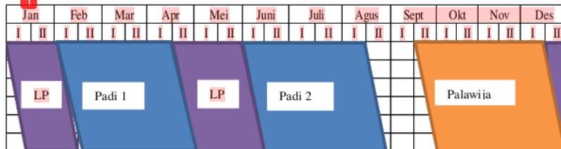
Tabel 8 Perencanaan Pola Tanam

Dari hasil analisis yang dilakukan, Pada 24 analisis hasil yang memiliki kebutuhan air paling rendah adalah alternatif ke 24 dengan masa tanam dimulai pada Desember periode ke II.