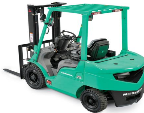
Gambar 3. 1 Jenis forklift yang digunakan PT Garam (Persero)

Alat penanganan produk yang digunakan disini adalah forklift, yaitu alat transportasi yang berfungsi untuk mempermudah melakukan kegiatan pengangkutan dan peletakkan produk jadi ke gudang transit.