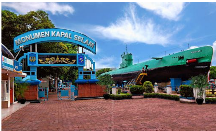
Lampiran 1.1. Monumen Kapal Selam (Monkassel 2020)