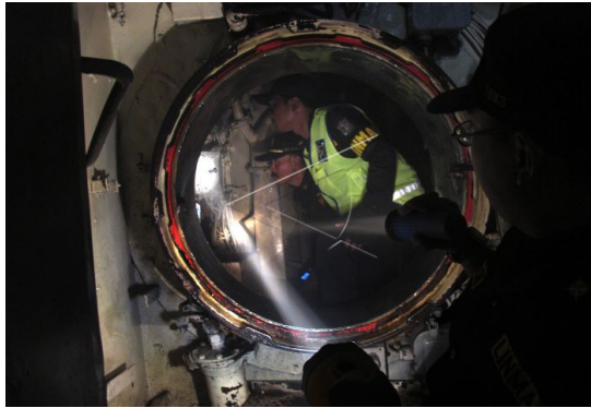
Lampiran 1.3. Petugas Linmas memeriksa bagian kapal yang terbakar