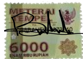
Buffon Riyono Hadi