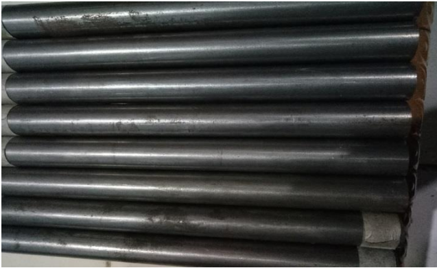
Gambar 6 sebelum proses lapisan electroplating