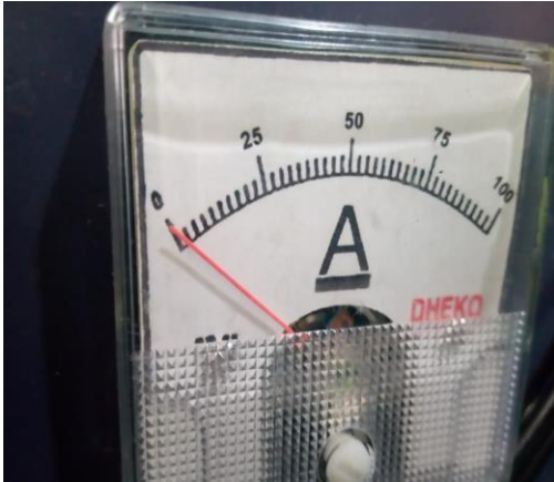
Gambar 9 Avometer untuk mengetahui Arus Baja ST 41