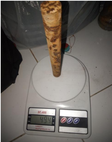
Gambar 12 Hasil penimbangan berat akhir