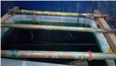
Gambar 7 proses pencelupan lapisan electroplating