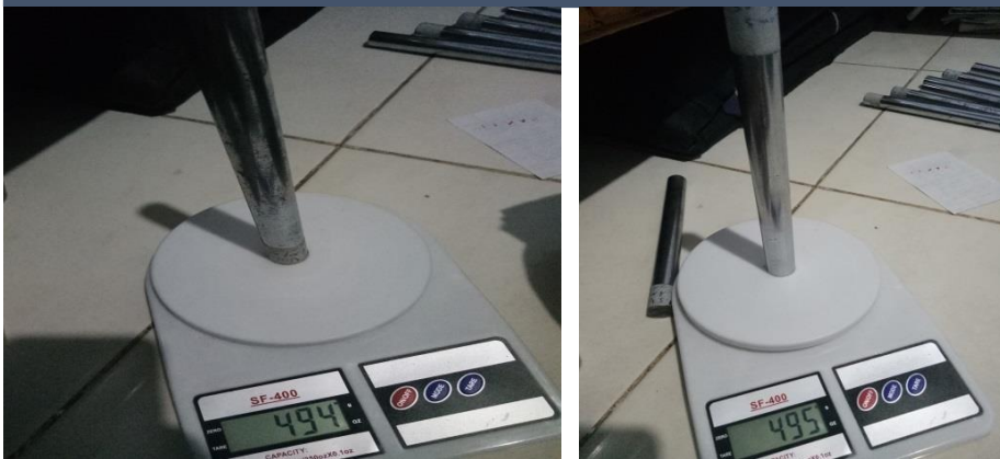
Gambar 11 Hasil penimbangan berat awal