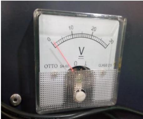
Gambar 8 Avometer untuk mengetahui tegangan Baja ST 41