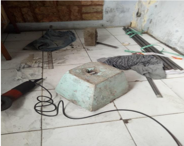
Gambar 4 proses pemotongan baja ST 41