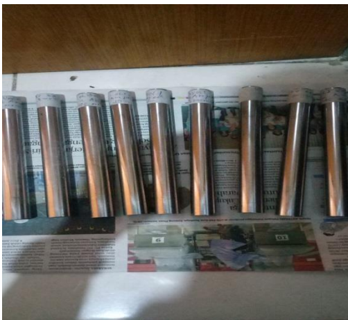
Gambar 10 hasil pelapisan electroplating Baja ST 41