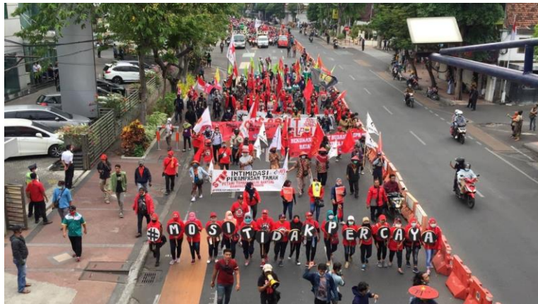
Gambar 2 : Liputan demo Buruh Tolak UU Cipta Kerja (20/10/20)