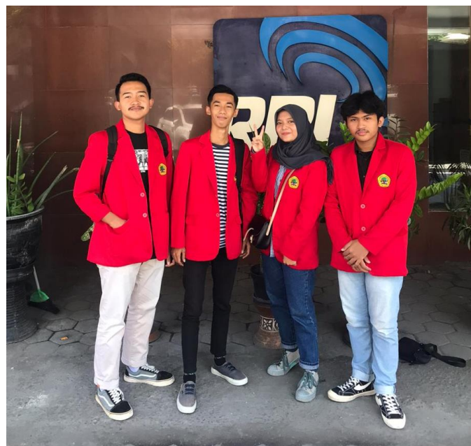
Gambar 6 : Foto didepan Kantor RRI Surabaya