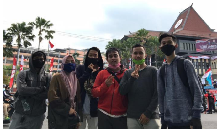
Gambar 3 : Liputan Demo Buruh di depan gedung DPRD