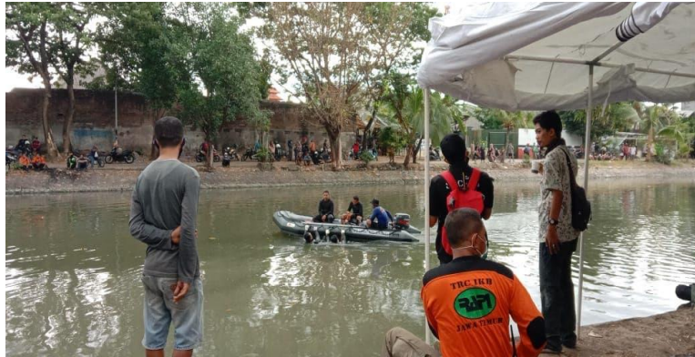
Gambar 1 : Liputan korban tenggelam di Sungai Kalimas