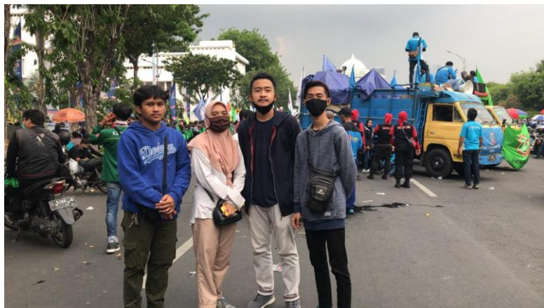
Gambar 5 : Liputan Demo Buruh di gedung Gubernur