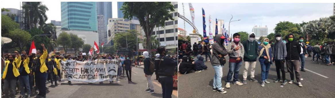
Gambar 1 dan 2 : Liputan Demo Onibuslaw Tolak RUU KUHP

Tak jarang berita yang kami produksi di publikasikan di dalam website rri.co.id, karena pembahasan atau berita yang kami produksi menarik dan hangat, khususnya dalam bidang informasi publik. Cara kerja jurnalis online terbilang cukup gesit, hal tersebut dapat kami buktikan melalui pengalaman kami dalam kegiatan liputan di lapangan.