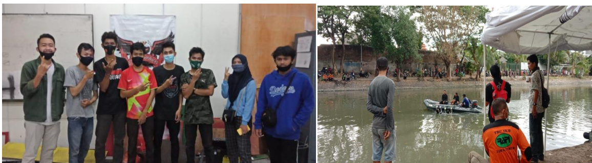
Gambar 3 dan 4 : Liputan tim pembuat robot dari Untag dan Liputan evakuasi bocah tenggelam di sungai Kalimas Surabaya

Tugas yang diberikan Kabid Pemberitaan RRI selaku penanggung jawab kami yaitu mencari/meliput berita yang sedang terjadi, kemudian membuat artikel berita mengenai hasil berita yang didapat