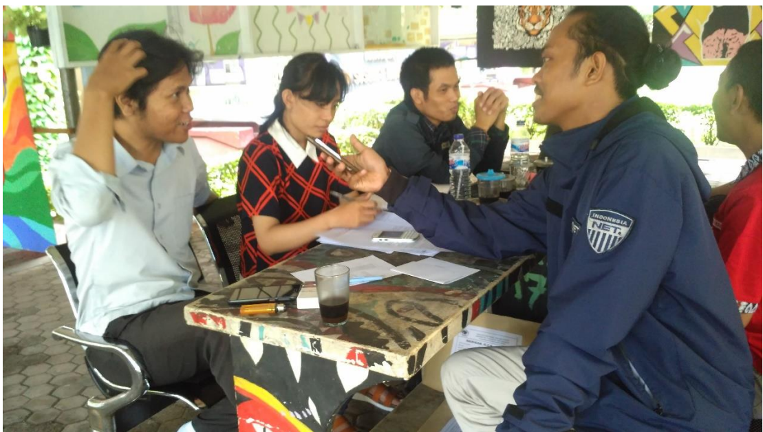
Wawancara dengan Informan