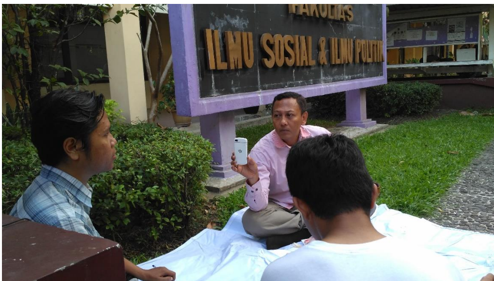
Kegiatan Forum Diskusi