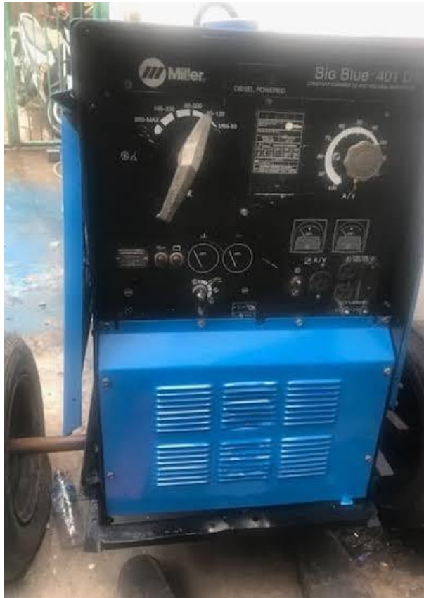
Mesin las AC