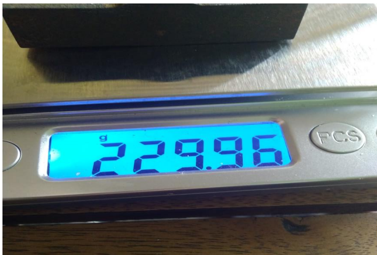
Penimbangan berat sebelum perendaman