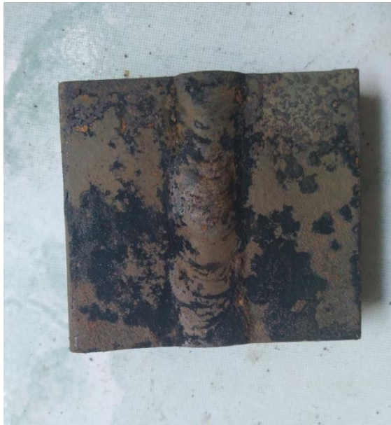
Benda Uji setelah melalui proses perendaman