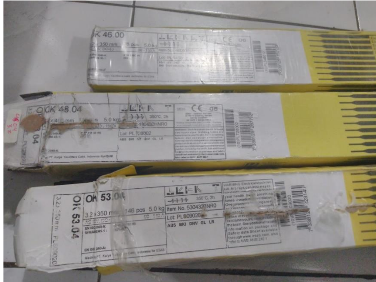
Jenis elektroda yang digunakan