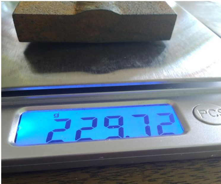
Penimbangan setelah perendaman