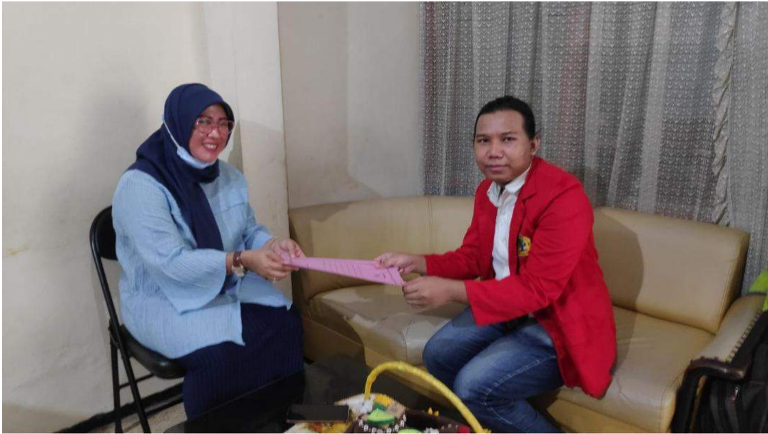
Gambar 2. Kepala Sekolah SLB Among Asih