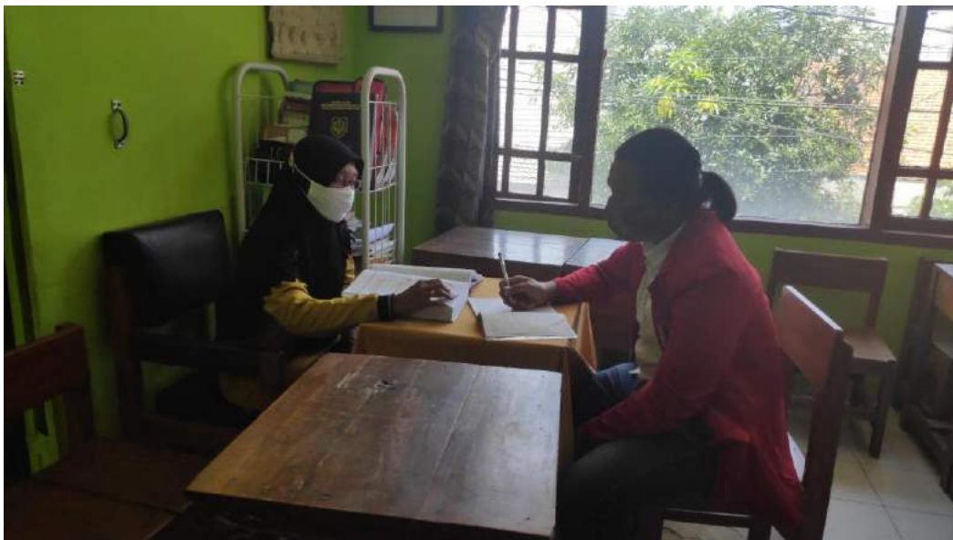
Gambar 3. Guru SLB Among Asih