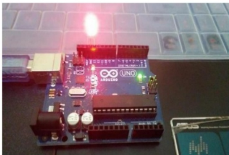
Gambar 6. Pengujian pada IDE arduino

Yang uji coba pada board arduino yang disebut dengan papan pengontrol atau papan mikrokontroler sebagai alat untuk memproses, pin yang terhubung, cara mengecek arduino masih berfungsi dengan baik adalah dengan menggunakan lampu LED. Sebagai penanda jika masih masih berfungsi dengan baik maka lampu LED pada arduino akan menyala.