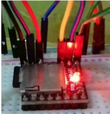
Gambar 9. DFPlayer

DFPlayer akan menerima inputan dari arduino sesuai program yang dibuat untuk menghasilkan output dimana DFPlayer akan menyala dan akan mulai mengaktifkan speaker agar mulai mengeluarkan suara dan hasil rekaman yang telah telah dimasukan kedalam micro SD.