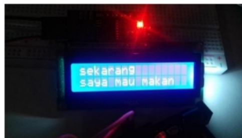
Gambar 8. LCD

Dalam pengujian LCD saya menggunakan Model lcd 16x2 yang berfungsi untuk memunculkan tulisan