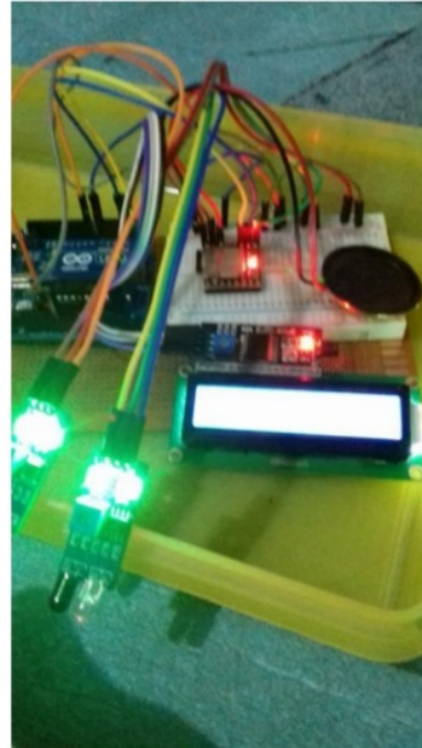
Gambar 7. Pengujian Sensor IR

kemudian sensor IR akan mendeteksi objek didepanya, LED akan menyala, jika lampu LED akan menyala dua-duanya menandakan bahwa sensor IR berfungsi dengan baik.