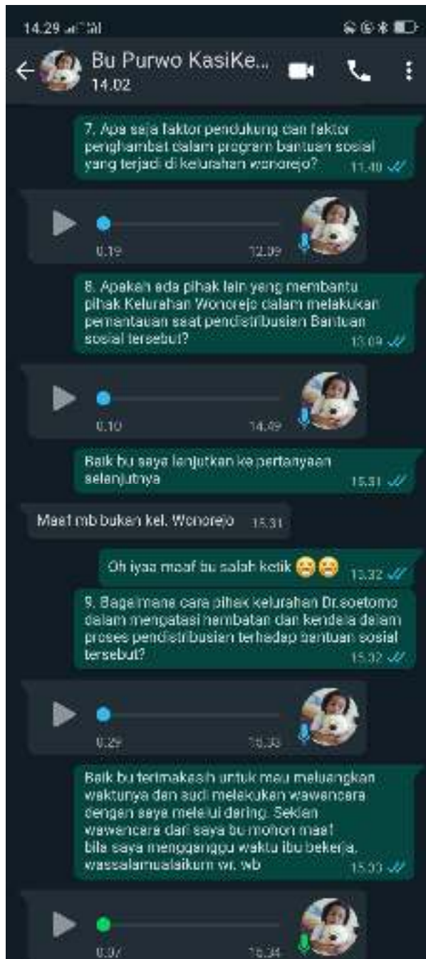
Dokumentasi Foto Wawancara Peneliti dan Kepala Seksi Kasih Kesejahteraan Sosial Kelurahan Dr. Soetomo, Kecamatan Tegalsari