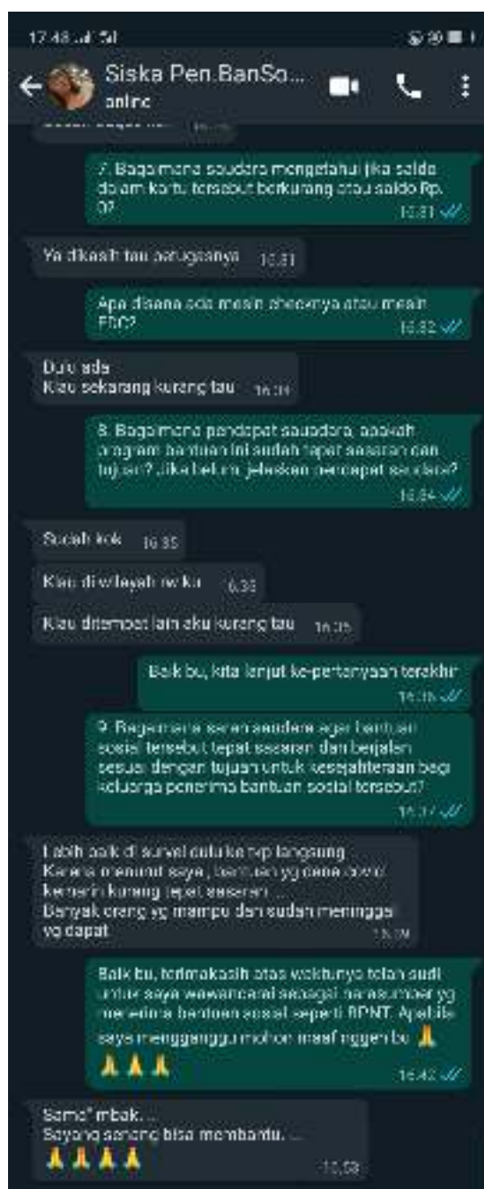
Dokumentasi Foto Wawancara Peneliti dengan Masyarakat Kelurahan Dr. Soetomo, Kecamatan Tegalsari