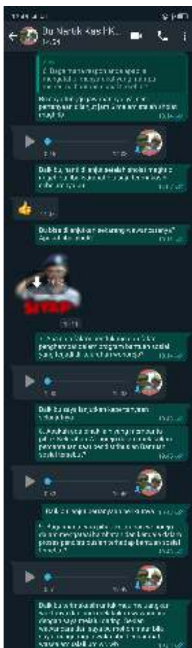
Dokumentasi Foto Wawancara Peneliti dan Kepala Seksi Kasih Kesejahteraan Sosial Kelurahan Wonorejo, Kecamatan Tegalsari