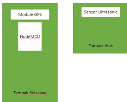
Gambar 2 Diagram Mekanik

Pada gambar Gambar 3.4 menunjukkan alat tampak dari belakang dan atas . Adapun penjelasan dari Gambar 3.4 sebagai berikut :