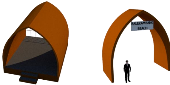
COTTAGE & ENTRANCE