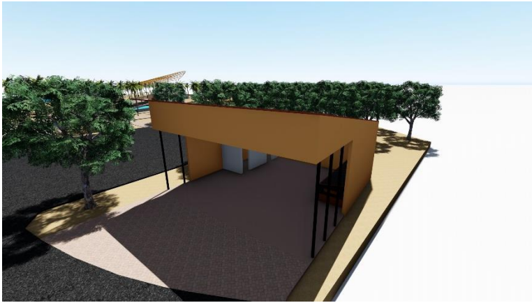
TEMPAT PEMBUANGAN AKHIR