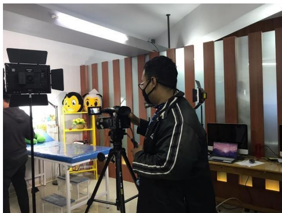
Gambar 2.2 proses persiapan live streaming STETOSKOP PORTABEL