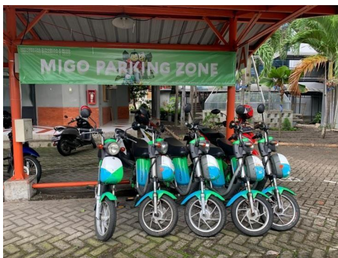
Gambar 2.4 & 2.5 Foto maskot yang bekerja sama dengan migo