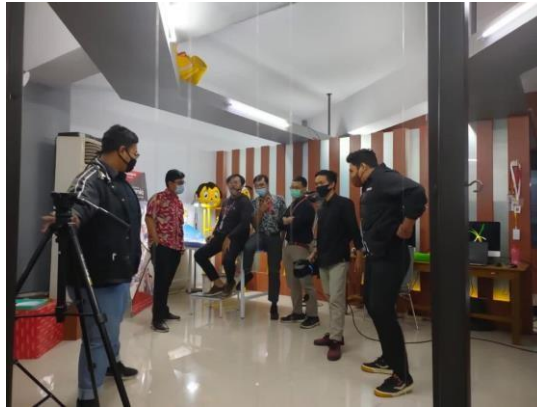
Gambar 2.9 Suasana ruang kerja

Selama magang berlangsung, peserta juga mengalami beberapa kesulitan. Namun, kesulitan tersebut dapat diatasi dengan baik karena komunikasi yang berlangsung dibangun cukup baik. Sehingga, tak jarang peserta magang dituntut untuk memutar otaknya demi mencari solusi dan saran pemecahan masalah ketika sedang terkena isu yang sekiranya dapat dimasuki.