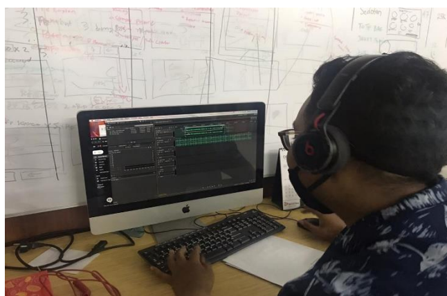
Gambar 2.3 proses pengeditan

Selain live streaming melalui sosial media conference yaitu google meet dan zoom, mahasiswa magang juga diberikan kesempatan untuk berpartisipasi dalam pengontrolan jalannya live streaming. Serta mahasiswa magang juga memperoleh pengalaman baru tentang bagaimana suasana dibalik layar saat live streaming yang dilakukan oleh instansi Pendidikan dengan format yang formal.