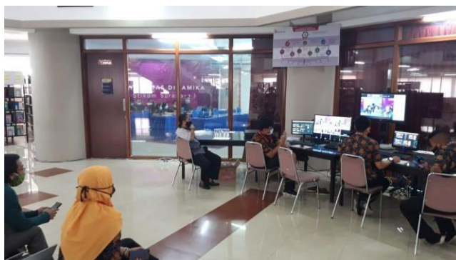
Gambar 2.6 proses akreditasi

Berhubung salah satu program studi di Universitas Dinamika hendak melakukan akreditasi yaitu program studi S1 Desain Produk, kami berkesempatan besar dalam membantu kesuksesan akreditasi tersebut. Mahasiswa magang membuat video company profile tentang program studi dengan menampilkan borang-borang penilaian seperti visi misi, tenaga pendidik, sarana prasarana, dan sebagainya. Mahasiswa magang melakukan pengambilan video selama 2 hari dan melakukan pengeditan selama 3 hari. Tak hanya itu, karena akreditasi program studi S1 Desain Produk dilakukan secara online, maka Mahasiswa magang turut membantu dalam mempersiapkan dan melaksanakan kegiatan tersebut. Dengan mendokumentasikan beberapa momen dan menjadi kameramen saat penilaian akreditasi berlangsung. Kegiatan akreditasi program studi ini dilakukan selama 2 hari dan berhasil mendapatkan Akreditasi “B”.