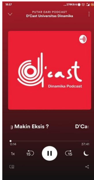
Gambar 2.1 D'Cast Episode 9 POCONG MAKIN EKSIS?

Disini salah satu mahasiswa magang diberikan kesempatan menjadi narasumber podcast, dengan beberapa pengalaman yang sudah didapatkan saat perkuliahan maka mahasiswa magang mencoba untuk research terlebih dahulu topik yang akan dibahas, dengan begitu ketika take podcast announcer menanyakan seputar topik, narasumber tidak bingung untuk menjawab dengan sesuai bidang keahlian masing masing, D'Cast Episode 9 ini adalah episode untuk merayakan halloween dengan mengangkat tema “ SETAN LOKAL “ dengan begitu semua pendengar podcast tetap bisa hawa dari halloween dengan ada nya episode ini. Salah satu mahasiswa magang menjadi narasumber dengan perspektif dari dunia perfilman dan sinematografian, topik yang cukup menarik dengan 2 narasumber yang berlawanan perspektif namun tetap bisa berinteraksi dan memberikan efek seram kepada pendengar dengan pertanyaan pertanyaan yang ditanyakan oleh announcer.