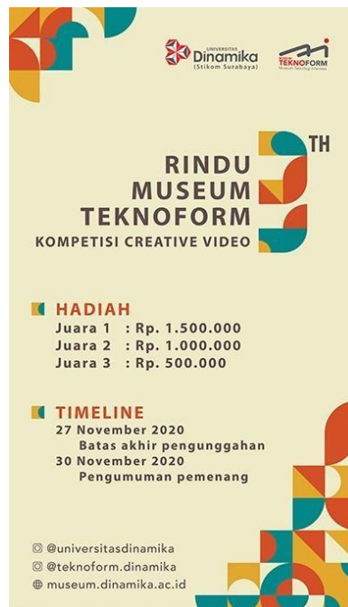
Gambar 2.7 Lomba Memperingati 3 Tahun Museum Teknofom

secara tidak langsung sebagai branding dari Universitas Dinamika Surabaya. Lomba ini berjalan dengan lancar dan diikuti oleh beberapa peserta