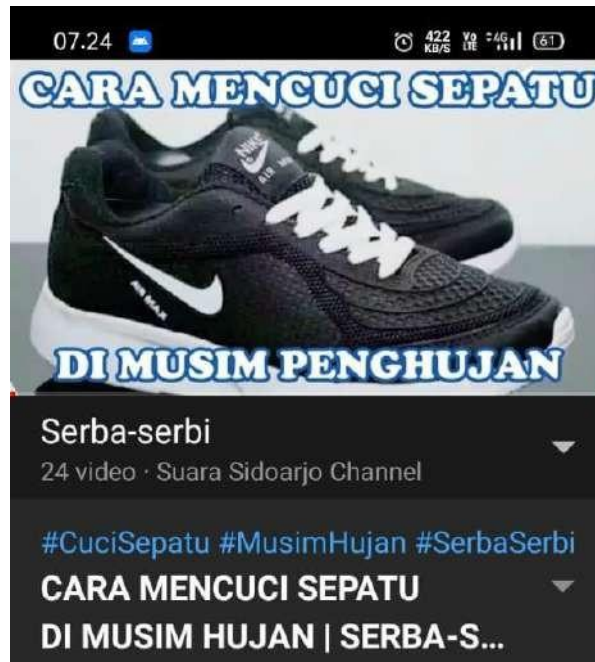
Gambar 2.6 Konten Serba-serbi

Selain dibagian redaksi, mahasiswa juga diberi tugas dibagian divisi produksi. Dibagian ini mahasiswa diberi tugas membuat dan mengisi konten-konten video untuk playlist Serba-serbi di Youtube Channel Suara Sidoarjo. Konten yang dibuat adalah konten seputar tempat, wisata yang menarik untuk dikunjungi yang ada di Kabupaten Sidoarjo. Selain itu, konten Seba-Serbi juga dapat diisi dengan seputar tips dan trik yang informatif.