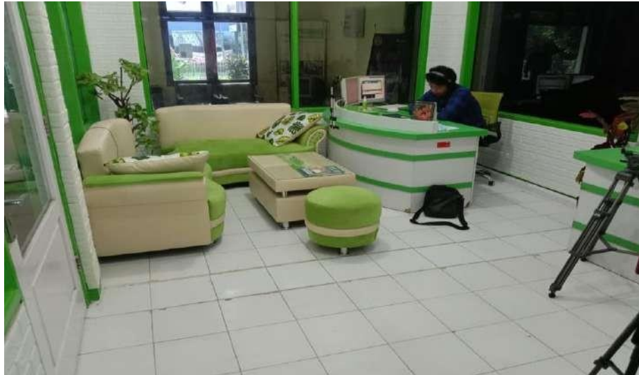
Gambar 2.7 StudioSiaran

Pada bagian ini dijelaskan faktor pendukung selama mahasiswa magang melakukan aktivitas atau pekerjaan selama magang di Radio Suara Sidoarjo. Serta dijelaskan juga faktor penghambat atau tingkat kesulitan yang harus dihadapi oleh mahasiswa magang selama melaksanakan magang di Radio Suara Sidoarjo.