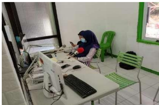
Gambar 2.8 Ruang Redaksi

Untuk faktor pendukung bagi mahasiswa magang adalah fasilitas dan alat penunjang kerja yang cukup memadai sehingga kinerja mahasiswa magang lumayan terbantu. Seperti ruang kerja yang nyaman, serta mahasiswa magang juga diberi tempat meja pribadi dan komputer pribadi untuk mengerjakan tugas yang diberikan oleh tim redaksi Radio Suara Sidoarjo.