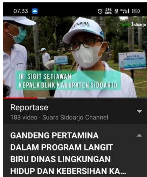
Gambar 2.3 Hasil Liputan yang diupload di Youtube

Mahasiswa magang juga diberi kesempatan untuk ikut dan praktik tugas lapangan atau Liputan. Dalam kegiatan ini terdiri dari dua orang reporter dengan tugas masing-masing. Reporter pertama diberi tugas untuk menulis narasi berita. Sedangkan mahasiswa yang sebagai reporter kedua, diberi tugas untuk menangani bagian visual saat liputan atau juru kamera