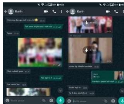
Gambar 2.5 Chat dengan anggota redaksi

Dalam beberapa kesempatan, Mahasiswa juga diberi tugas saat dirumah atau WFH. Tugas yang diberikan adalah menambakan template untuk Foto. Template yang dimaksud adalah alamat sosial media Radio Suara Sidoarjo. Proses komunikasi saat kerja dari rumah atau WFH menggunakan aplikasi chatting Whatsapp.