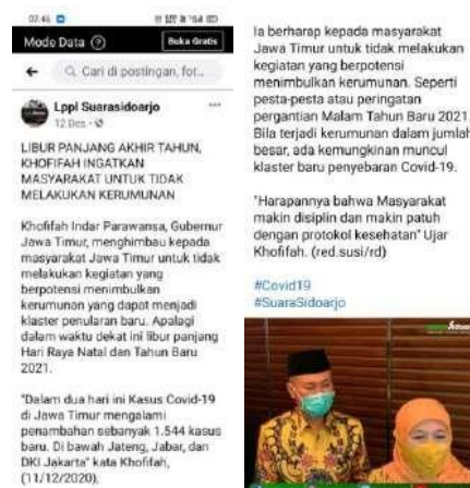
Gambar 2.2 Berita

Di minggu berikutnya, mahasiswa magang diberi tugas untuk menulis berita yang dipublikasikan di sosial media Radio Suara Sidoarjo. Seperti Instagram, Facebook, dan Twitter. Berita yang akan dibuat atau ditulis adalah berita yang harus memuat tentang informasi, peristiwa yang berasal dari regional sidoarjo, surabaya, dan jawa timur.