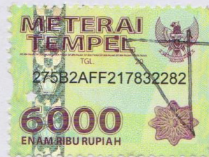
Renanta Dwi Prawira