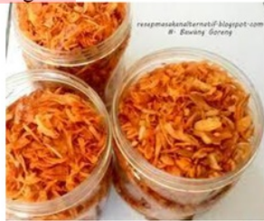
Gambar Bawang Goreng

Bawang goreng merupakan makanan yang terbuat dari bawang merah yang digoreng dengan minyak. Bawang goreng banyak didapat di toko atau warung yang sudah dikemas dan juga ada yang diberi label. Rasanya yang nikmat serta harganya yang terjangkau.