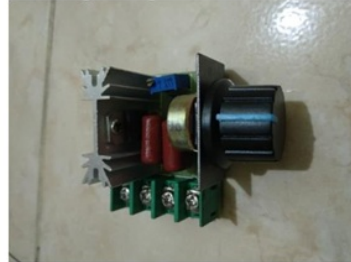
Gambar Pengatur Kecepatan

saat proses pengujian, yaitu stopwatch, tachometer, inverter/speed controller motor AC, timbangan digital.