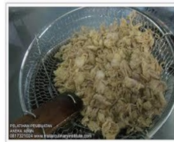
. Bawang Goreng