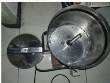
Gambar Mesin Peniris Bawang Goreng

Langkah pertama yang kita lakukan adalah mempersiapkan komponen mesin yang akan kita gunakan dalam proses pengujian, yaitu mesin peniris dan 3 buah tabung putar dengan berbeda ukuran.