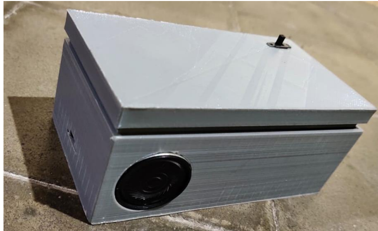
Lampiran 1. Gambar Realisasi Alat