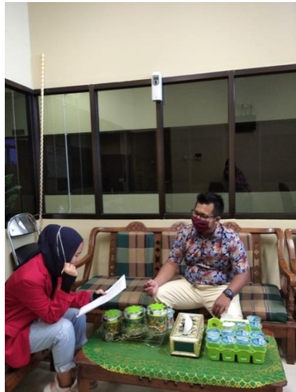
Wawancara bersama Kabid Adminduk