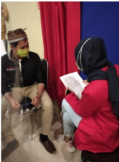
Wawancara bersama Pegawai Pelaksana