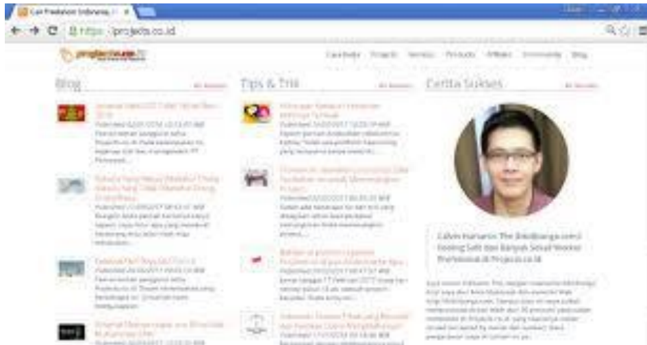
Gambar 1. Pemberi Kerja atau Project Owner ( www.bibitbunga.com )

Dengan demikian, dapat dikatakan bahwa hambatan jarak tidak menjadi permasalahan yang amat penting baik bagi freelancer maupun pemberi kerja. Hal ini sesuai dengan asumsi ketiga pada teori ekologi media McLuhan dijelaskan bahwa media menyatukan seluruh dunia; mereka berada di bagian paling ujung dunia agar bisa dengan mudah menyapa dan berkomunikasi dengan orang lain yang ada di ujung dunia lainnya. Jadi, persoalan persoalan jarak dan waktu sudah berbalik menjadi kesempatan dan peluang. Hal ini juga diamini pernyataan para informan yang menyebutkan bahwa mereka sudah tidak kesulitan lagi berkomunikasi dengan pemberi kerja meski dipisahkan jarak ribuan kilometer jauhnya. (Siaha Widodo, 2019)