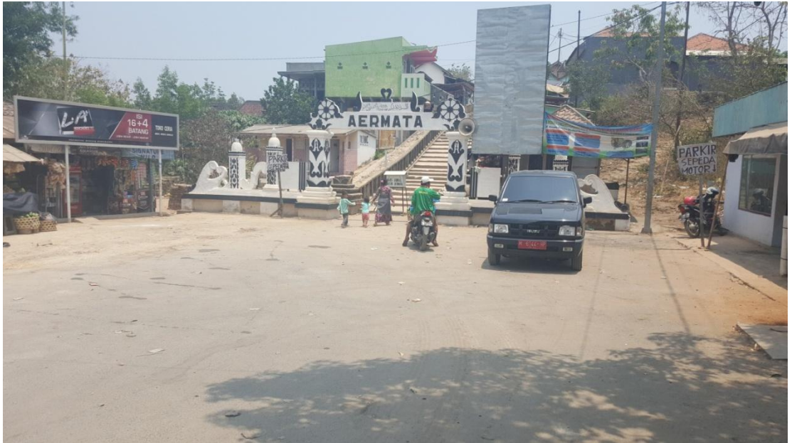
Gambar 1. Lokasi Putar dan Parkir Bus