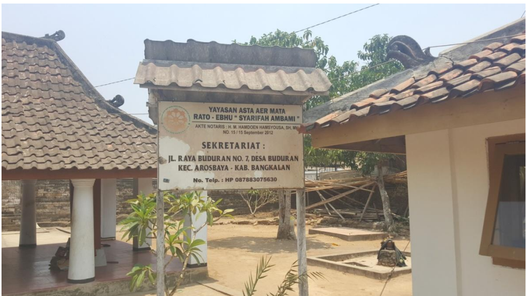
Gambar 4. Yayasan Pengelola Makam