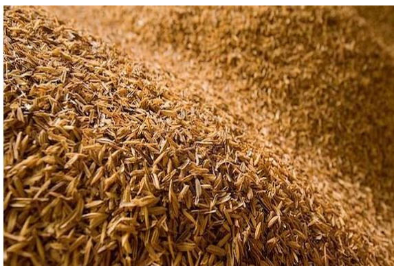
Gambar 2.1. Sekam Padi

Sekam padi merupakan lapisan keras yang meliputi kariopsis yang terdiri dari dua belahan yang disebut lemma dan palea yang saling bertautan. Pada proses penggilingan beras sekam akan terpisah dari butir beras dan menjadi bahan sisa atau limbah penggilingan. Sekam dikategorikan sebagai biomassa yang dapat digunakan untuk berbagai kebutuhan seperti bahan baku industri, pakan ternak dan energi atau bahan bakar. Dari proses penggilingan padi biasanya diperoleh sekam sekitar 20-30%, dedak antara 8- 12% dan beras giling antara 50-63,5% data bobot awal gabah.