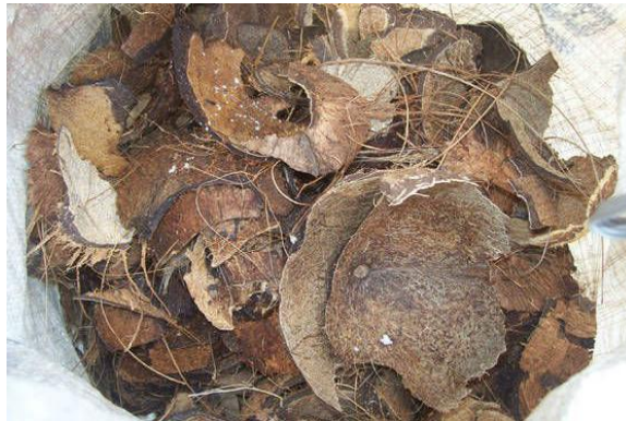
Gambar 2.2 Tempurung Kelapa