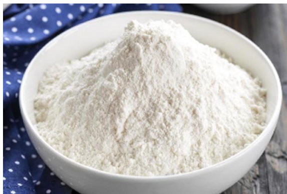
Gambar 2.3. Tepung Tapioka

Tapioka adalah tepung pati yang diekstrak dari umbi singkong. Tepung tapioka juga mempunyai beberapa sebutan lain, seperti tepung singkong atau tepung kanji, dan tepung aci. Pada umumnya tepung tapioka dibagi menjadi dua, yaitu tapioka halus dan tapioka kasar. Pembuatan tepung tapioka halus biasanya dari tapioka kasar yang mengalami penggilingan kembali. (Koswara, 2009)