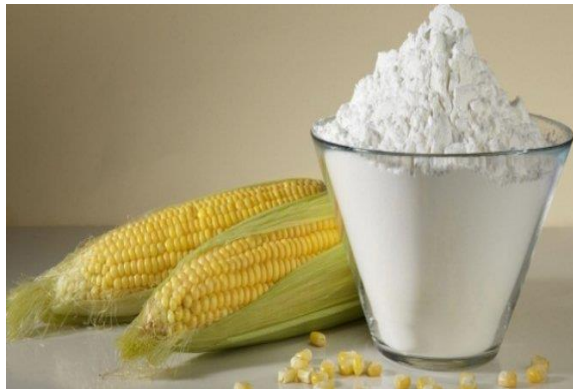
Gambar 2.4. Tepung Maizena

Penggunaan pati jagung sangat luas baik untuk bahan pangan maupun non pangan . Sebagai bahan pangan biasanya digunakan untuk pembuatan sirup jagung fruktosa tinggi. Sebagai bahan non pangan biasanya digunakan di indutri kertas, tekstil dan untuk bahan perekat.