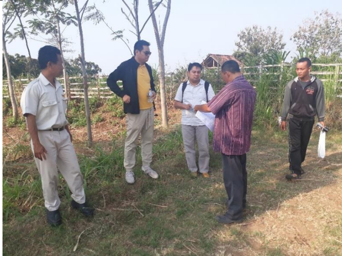
BATAS LAHAN EKSISTING