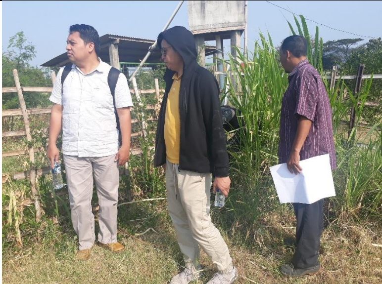
BATAS LAHAN EKSISTING