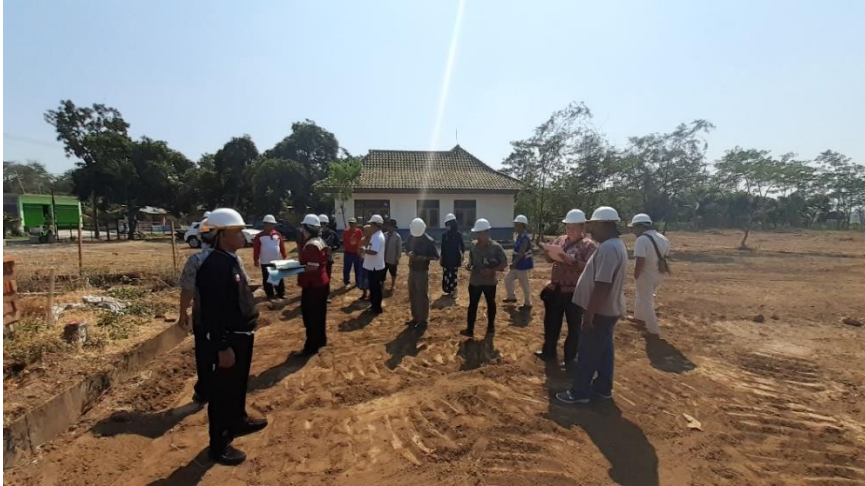
PERSIAPAN PENGUKURAN LAHAN