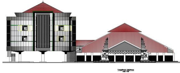
Gambar Tampak Depan Gedung Serba Guna