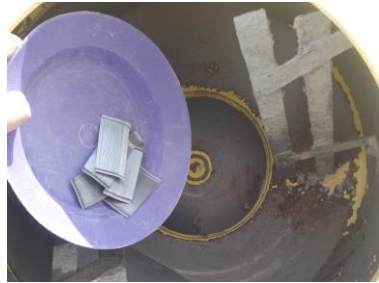
Penaburan Serat Baja