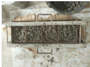
Penuangan Beton ke Cetakan