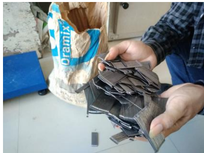
Serat Baja Steel Fiber (dramix)