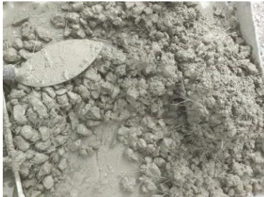
Campuran Beton Serat Baja