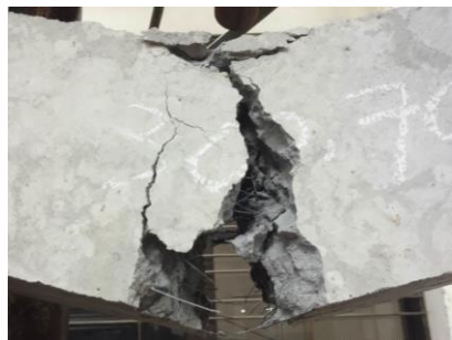
Benda Uji Setelah Pengujian