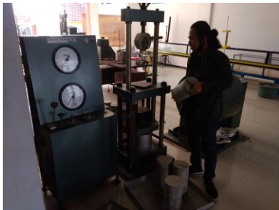
Mesin Tes Kuat Tekan