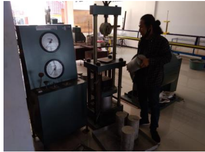
Pengujian Kuat Tekan Beton