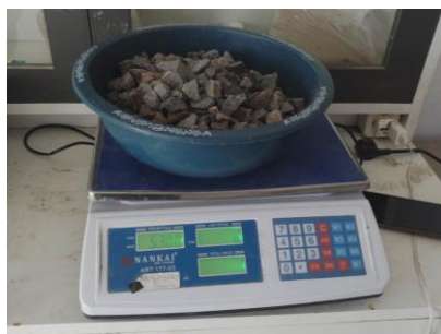
Penimbangan Agregat Kasar