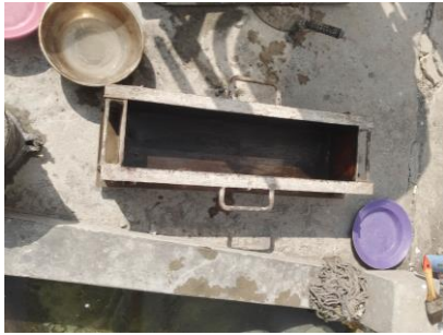
Cetakan Balok 15.15.60