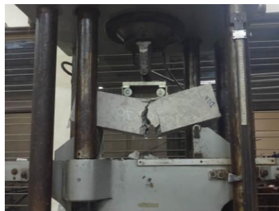
Pengujian Kuat Lentur Beton