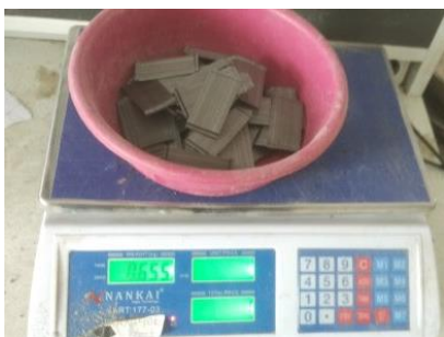
Penimbangan Serat Baja