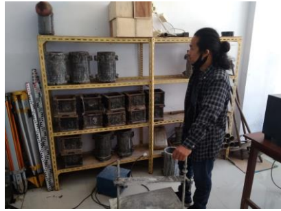
Cetakan Silinder Ø15.30