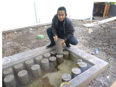
Perendaman Benda Uji