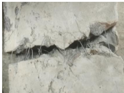
Benda Uji Setelah Pengujian