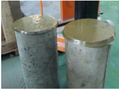
Capping Benda Uji