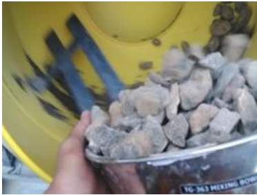
Proses Pencampuran Bahan