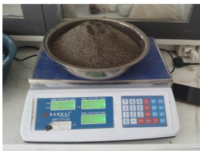
Penimbangan Agregat Halus