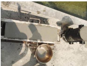
Benda Uji Silinder dan Balok