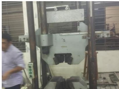
Mesin Tes Kuat Lentur