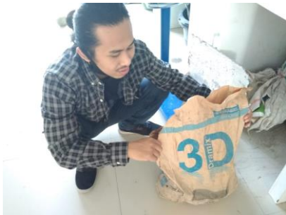
Serat Baja Steel Fiber (dramix)