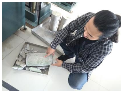
Benda Uji Setelah Pengujian