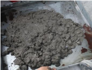
Campuran Beton Normal