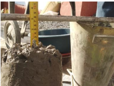
Pemeriksaan Nilai Slump