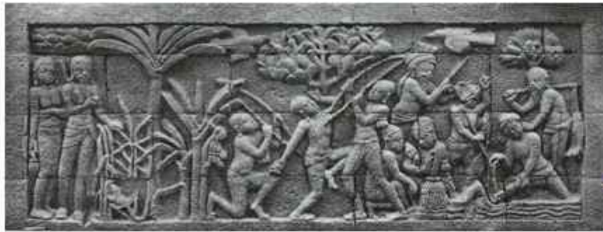
Batu Relief Pada bagian dinding terdapat relief yang menceritakan sejarah Dewi Sekardadu (Perjalanan dari kerajaan Blambangan sampai di lokasi saat ini di kebumikan)