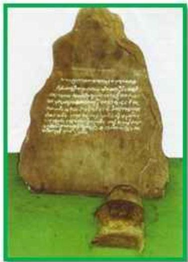
Batu Tulis Pada Setiap ujung terdapat beberapa batu tulis yang berisikan tentang informasi tentang sejarah Dewi Sekardadu