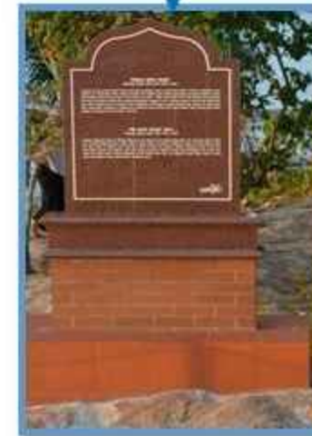
Batu Pahat Pada Setiap ujung jalan terdapat beberapa batu pahat yang berisikan tentang informasi asal mula Dewi Sekardadu