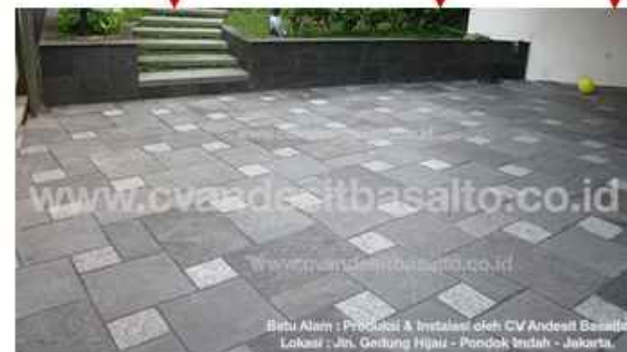
Batu Alam (Batu Andesit) Tidak mudah berlumut, colorfastness dan tahan terhadap radiasi sinar matahari