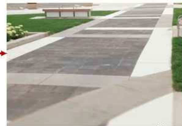
Concrete Paver Tidak mudah berlumut, daya serap air tinggi dan ramah lingkungan