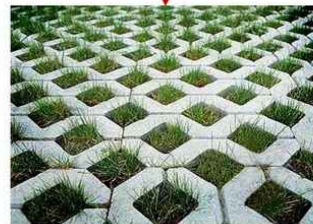
Grass Block Dapat memperindah, Tahan terhadap perubahan cuaca, Praktis dan efisien