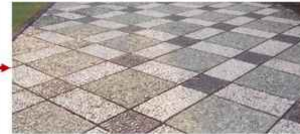
Batu Alam (Batu Koral) Memperindah jalan (pedestrian)