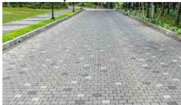
Paving Block Daya serap tinggi terhadap air, Perawatan mudah, Ramah lingkungan