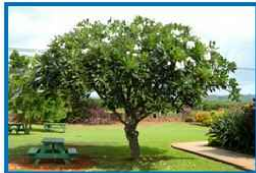
Pohon Kamboja Putih Tumbuhan yang pada umumnya menjadi symbol pemakaman.