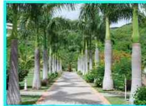
Pohon Palem Pohon yang digunakan untuk penghijauan dan sebagai penyejuk udara