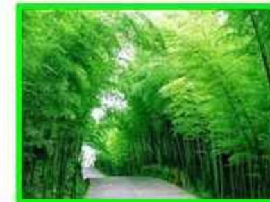
Pohon Bambu Tumbuhan peneduh yang dapat membuat suasana sejuk khusyuk dan tenang