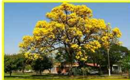
Pohon Angsana Tumbuhan peneduh yang dapat membuat pemandangan menjadi indah