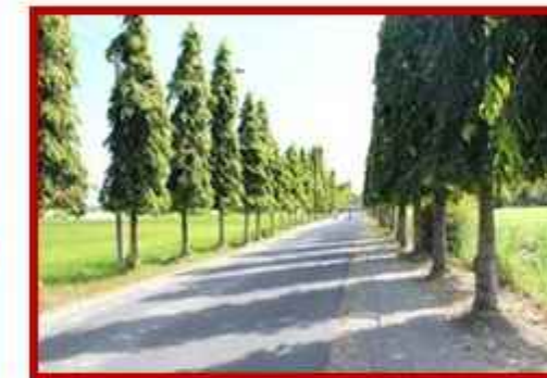
Pohon Gelodokan Tiang Tumbuhan peneduh yang dapat mengurangi polusi