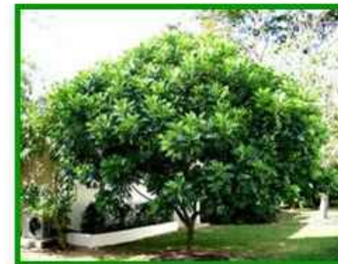
Pohon Kiara payung Tumbuhan yang dapat menyerap CO2 dengan sangat baik