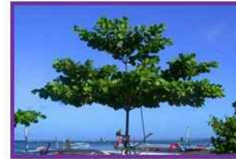
Pohon Ketapang Tumbuhan peneduh yang cocok jika ditanam didekat perairan