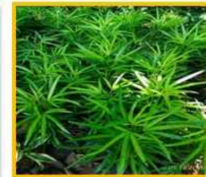
Perdu Kecil Tumbuhan yang berfungsi untuk pembatas antara jalan dengan taman