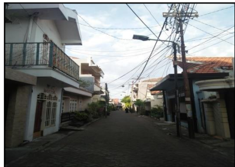
Gambar 4 : Kampung Ampel Surabaya