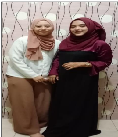
Gambar 7: Foto bersama informan pertama