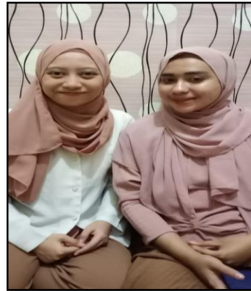
Gambar 6: Foto bersama informan kedua