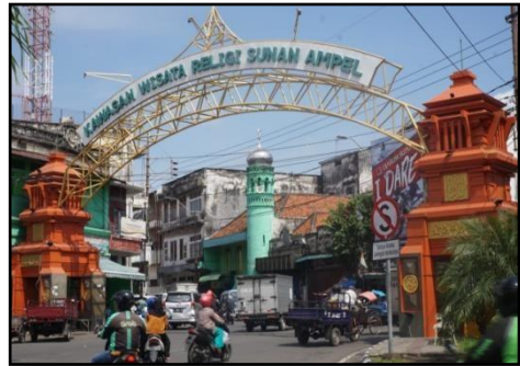
Gambar 2 : kawasan wisata religi