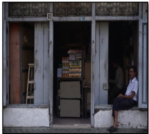
Gambar 9: Petokoan di daerah Ampel Suarabaya