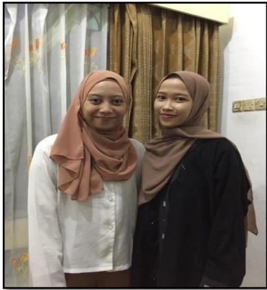
Gambar 5: Foto bersama informan ketiga