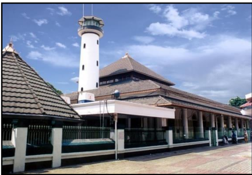
Gambar 3 : Masjid Sunan Ampel