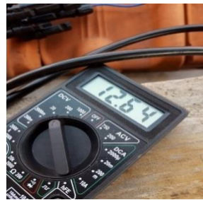
Gambar arus dan tegangan panel 2 jam 10.00 hari ke 2.