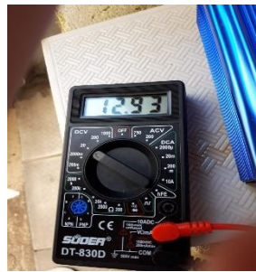
Gambar arus dan tegangan panel 3 di jam 14.00 hari ke 4.