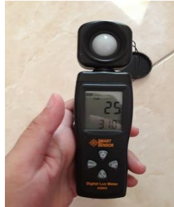
Gambar temperatur panel dan temperatur lingkungan panel 2 jam 10.00 hari ke 2.