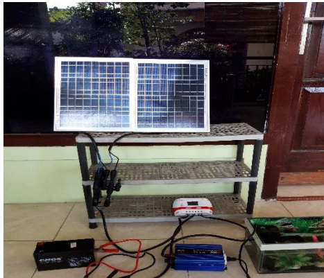
Gambar Rangkaian Panel 2.