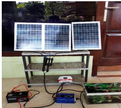
Gambar Rangkaian Panel 3.