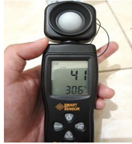
Gambar temperatur panel dan temperatur lingkungan panel 3 jam 14.00 hari ke 4.