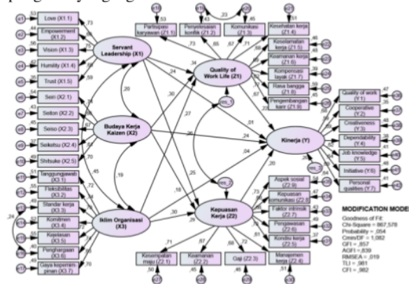
Gambar 2 Estimasi Overall Model SEM (Modification Model)

Tahap selanjutnya analisis structural model , yang menganalisis hubungan struktural antar variabel sesuai jalur yang ada pada gambar SEM. Analisis structural model dilakukan untuk menguji hipotesis dengan menggunakan nilai CR dan probabilitasnya. Parameter ada tidaknya pengaruh secara parsial dapat diketahui berdasarkan nilai CR (Critical Ratio) . Untuk menentukan ada tidaknya pengaruh variabel eksogen terhadap variabel endogen dan variabel endogen terhadap variabel endogen, digunakan ketentuan apabila nilai CR hitung \geq 1,96 atau nilai signifikansi \leq 0,05 , maka diputuskan ada pengaruh yang signifikan antar variabel tersebut.