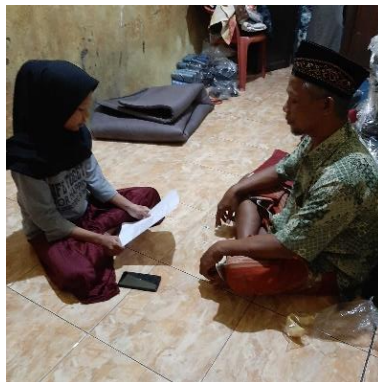
Wawancara dengan Pelaku UMKM Produksi Tas