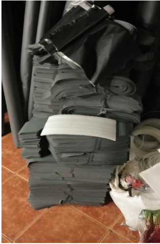
Foto Bahan Baku Tas dan hasil tas yang sudah jadi