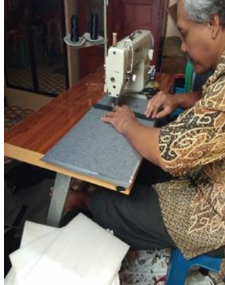
Foto Proses Menjahit Tas