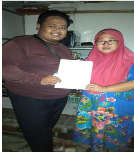
Foto wawancara dengan Pendamping PKH