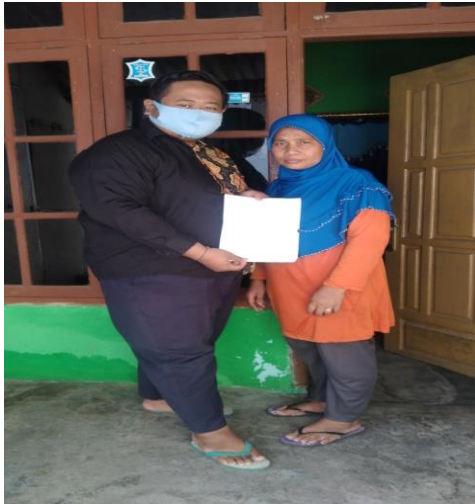
Foto wawancara dengan penerima PKH