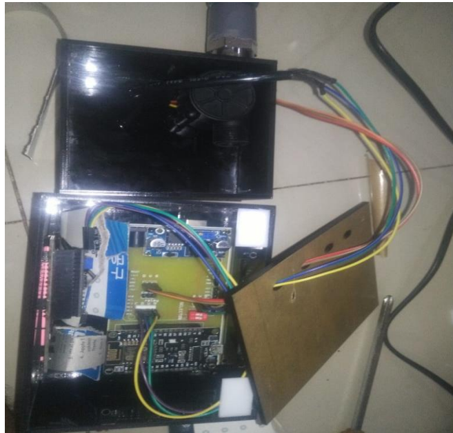
Gambar 5. 2 Rangkaian Alat Ukur Dari Dalam