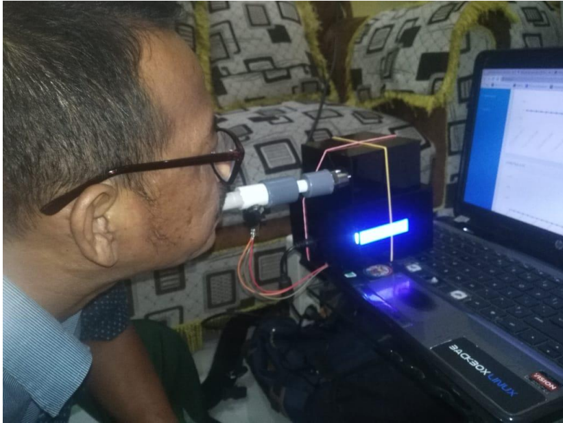
Gambar 5. 4 Testing Alat Ukur