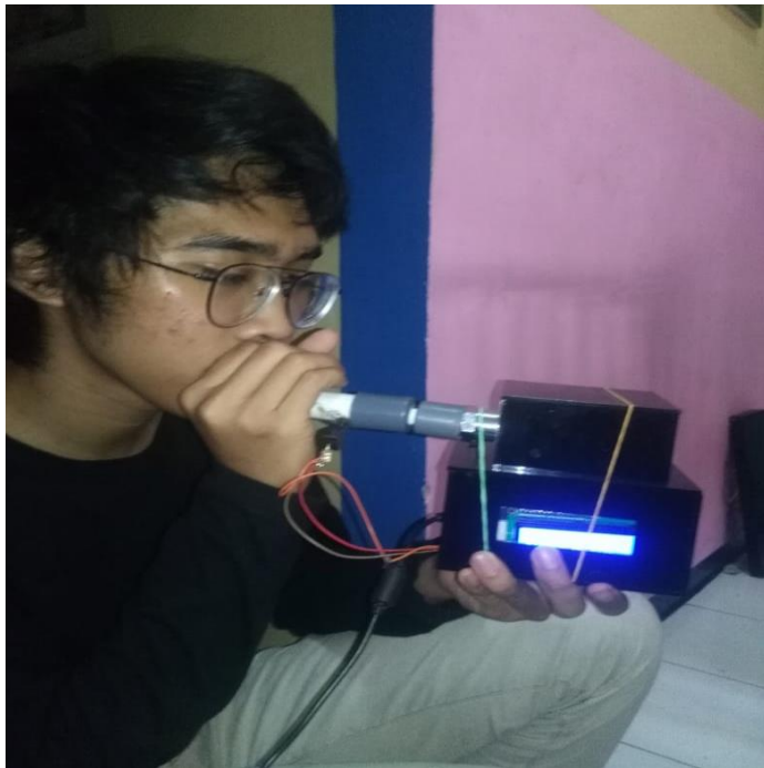
Gambar 5. 3 Mencari Sample