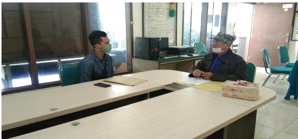
Foto Dokumentasi 3. Ketua BUMDes Kedungrejo