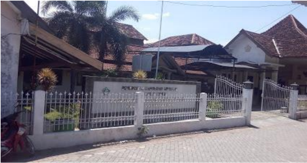
Foto Dokumentasi 1. Kantor Desa Kedungrejo