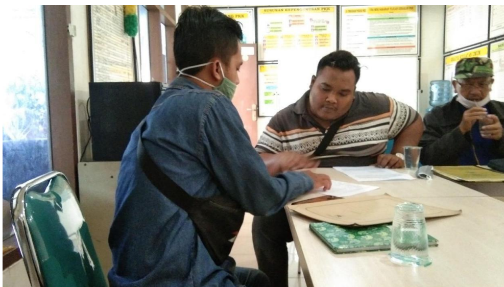
Foto Dokumentasi 4. Pegawai BUMDes Kedungrejo