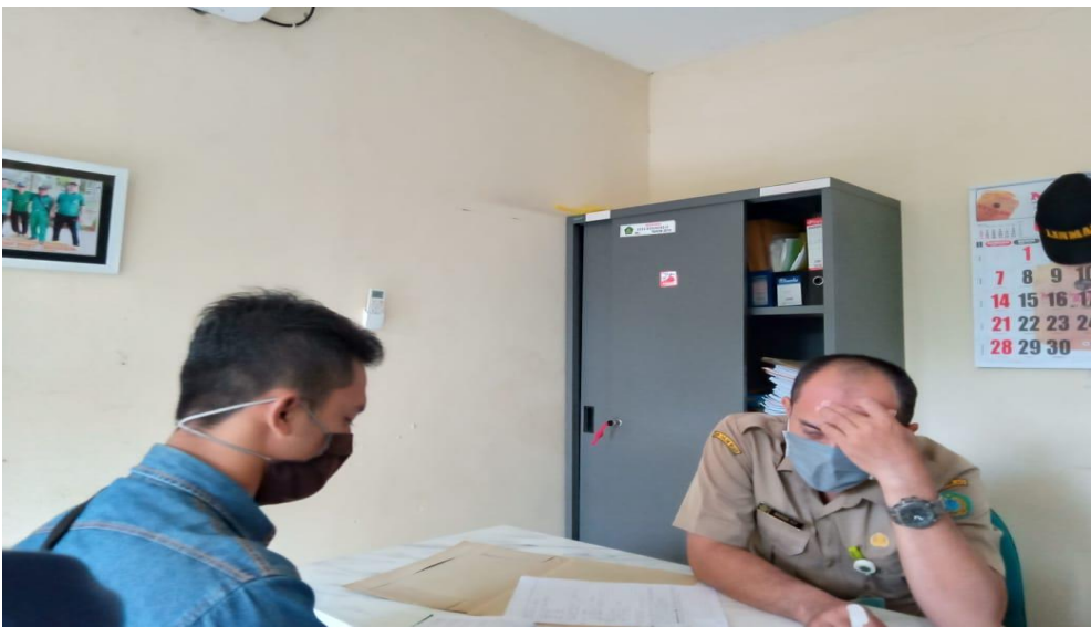
Foto Dokumentasi 2. Sekretaris Desa