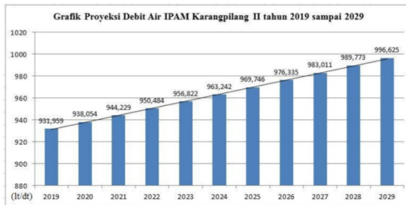
Grafik 3.1 Grafik Ketersediaan Air