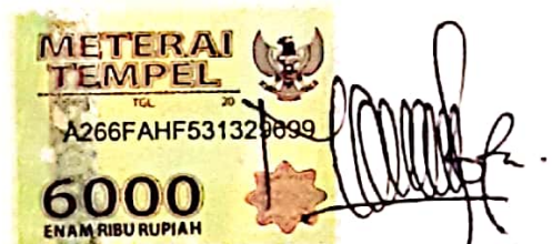
Nur Lailatul Hidayah