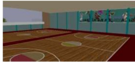
Gambar 11 Interior Lapangan bola basket

NIPPON WEATHERBOND diformulasikan khusus dengan menggandakan kekuatan dan daya tahan terhadap cuaca ekstrim. Produk ini mempunyai daya tahan yang tinggi terhadap kotoran, jamur, alga, pengelupasan dan alkali. Selain itu, cat ini mudah diaplikasikan dan menghasilkan permukaan yang halus, rata, memiliki daya sebar yang tinggi serta tidak mengandung timbal dan merkuri.