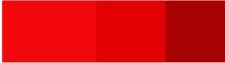
Gambar 5 Warna Eksterior

menyimbolkan tentang olahraga seperti merah, kuning, hitam, putih.