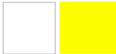
Gambar 4 warna Lagit-Langit