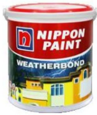
Gambar 10 Cat yang digunakan