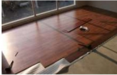
Gambar 2 Lantai Arena Bola Baske