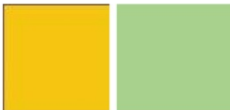
Gambar 3 warna dinding