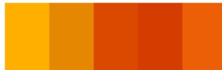
Gambar 9 Warna Eksterior Oranye