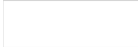
Gambar 8 Warna Eksterior Putih