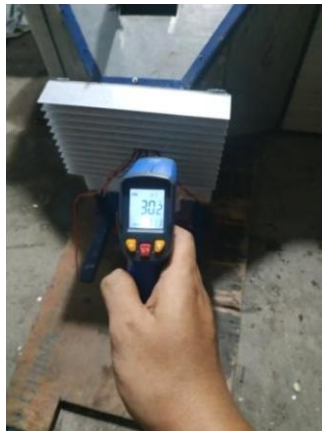
Proses pengambilan data