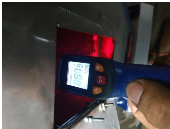
Proses pengambilan data